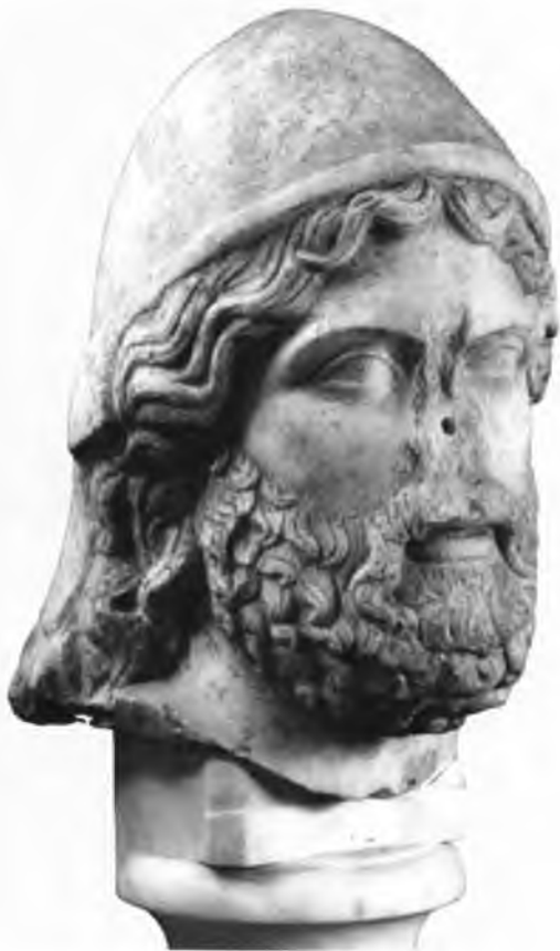
Marmorkopf des Odysseus, römisch, nach einem griechischen Original um 450 v. Chr.

Als die Römer mit den Griechen in näheren Kontakt traten, übernahmen sie