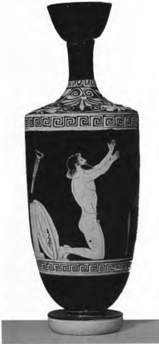
Ölgefäss (sog. Lekythos) mit Aias vor seinem Selbstmord, attisch, um 460 v. Chr.

Basel, Antikenmuseum und Sammlung Ludwig