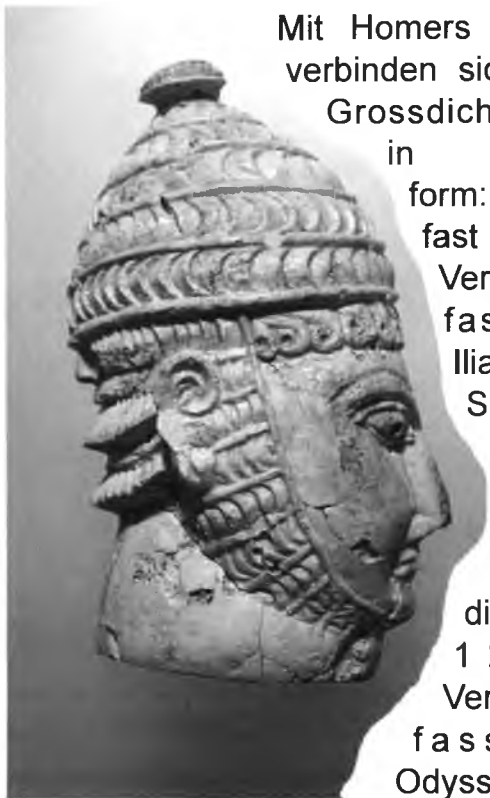
Kriegerkopf aus Elfenbein, aus Mykene, 14. Jahrhundert v. Chr.

Der Grieche Homer ist der erste namentlich genannte Dichter des westlichen Kulturkreises. Er lebte vor etwa 2700 Jahren an der westlichen Mittelmeerküste Kleinasiens, die damals Teil der griechischen Welt war, wahrscheinlich in der Region von Smyrna (heute Izmir) und der gegenüberliegenden Insel Chios. Neuere Forschungen lokalisieren ihn in Kilikien im heutigen türkisch-syrischen Grenzgebiet.