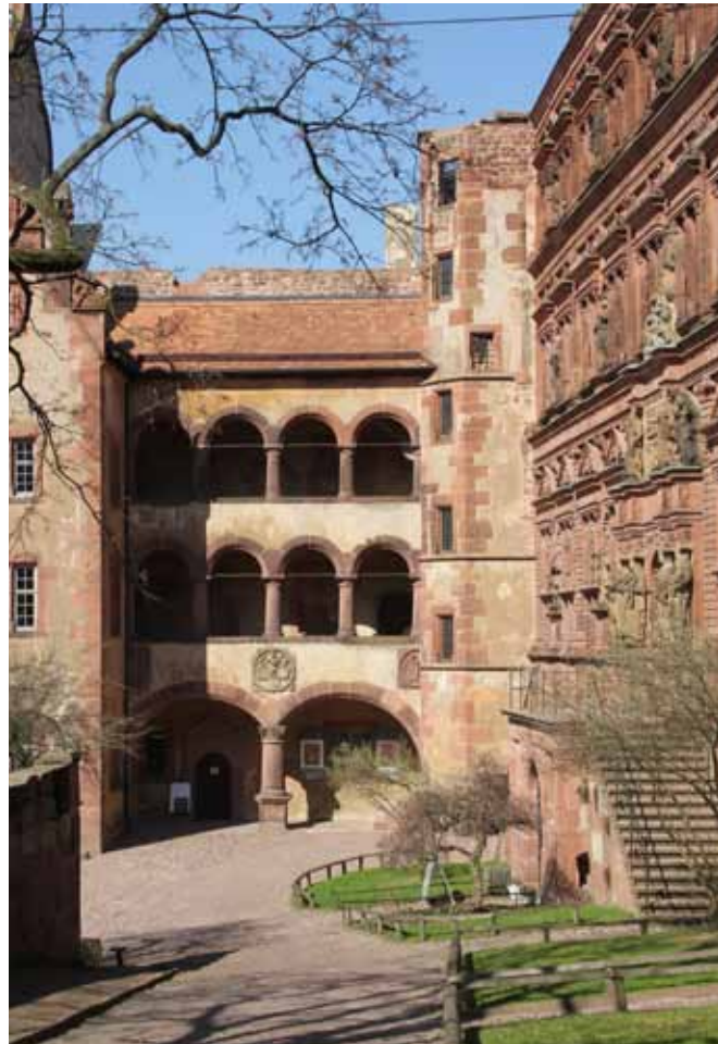
Vielleicht fand die schicksalhafte Begegnung hier statt: Arkadengänge im Gläsernen Saalbau

Mitchristen im Westen Europas, für die Reformierten in Frankreich (die dann so genannten „Hugenotten“) und in den spanischen Niederlanden. Gerade letztere, als Glaubensflüchtlinge in den aufgelassenen Klöstern Schönau und Frankenthal angesiedelt, brach-