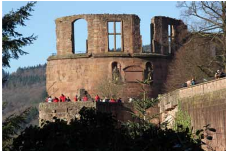
Ein Saal der seinesgleichen sucht: Der Festsaal auf dem Dicken Turm

Ende des Jahrzehnts krönt er den Königspalast in Heidelberg noch mit dem prächtigsten Festsaal, den die