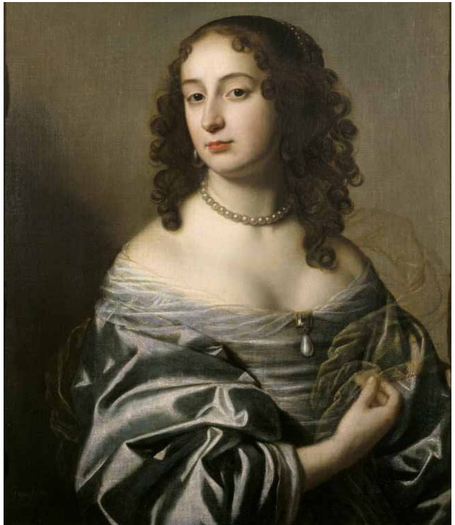
Unbekannter Künstler: Sophie von Hannover, Tochter der Königin von Böhmen, Mutter des englischen Königs George I.

sche Thronfolge mangels „ordentlicher“ Erben alle Schwiegersöhne durchlief, schließlich Königin Anne kinderlos blieb und das britische Parlament 1702, ganz im Sinn der Vorgaben von 1612, den „Act of Settlement“ verabschiedete, nach dem nur ein protestantischer Abkömmling der Stuarts erberechtigt sei, sah sich Sophie, die verheiratete Herzogin von Braunschweig-Lüneburg,