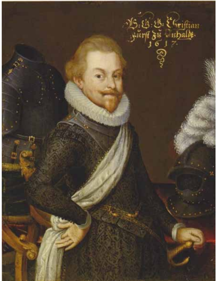
Unbekannter Maler: Christian Fürst zu Anhalt-Bernburg, 1517. Privatbesitz.

Christian von Anhalt hatte eine Lehre aus der politischen Gegenwart gezogen: der Augsburger Religionsfriede von 1555 war als Instrument der Friedenssicherung im Reich untauglich, und die Hoffnungen, die in ihn gesetzt wurden, waren allenfalls geeignet, lutherische Fürsten zufrieden zu stellen. Freiwillig war weder die