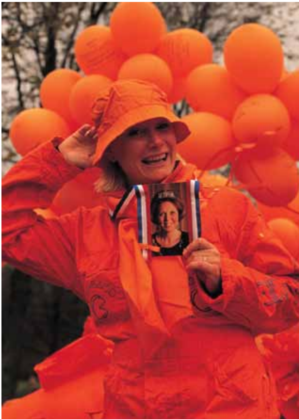
Wirkt nur in Farbe: Begeisterte Anhängerin der niederländischen Monarchie beim Königinnentag

Und genau dieses Haus Hannover verliert 1774 seine Kolonien in Neu-England an den calvinistischen Anspruch, eine Herrschaft, die dem Evangelium widerspricht, zu ändern oder abzuschaffen. „To alter or to abolish it“, formuliert die „Declaration of Independence“ als Credo ihres Strebens nach Selbständigkeit. Luther war davon weit entfernt. „Du sollst deiner Obrigkeit gehorsam sein, denn deine Obrigkeit ist von Gott“ zitiert er den Apostel Paulus – und legt damit den Grundstein für den deutschen Weg, sich der Obrigkeit zu fügen.