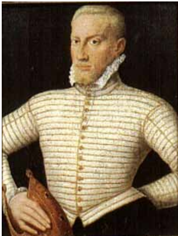
Hermann tom Ring (1521 - 1597: Gebhard Truchsess von Waldburg (1547 - 1601), Erzbischof von Köln 1577 - 1583.

1582 stellte sich die Frage der Mehrheitsverhältnisse im Kurfürstenkolleg. Bekanntlich waren es sieben Kurfürsten, die den römischen König und den Kaiser wählten. Die Erzbischöfe von Köln, Trier und Mainz waren – verständlicherweise – katholisch, katholisch war auch der König von Böhmen, das war der Habsburger selbst. Evangelisch waren Kurpfalz, Brandenburg und Sachsen. Schienen die Mehrheitsverhältnisse damit auf ewige Zeiten zementiert, öffnete sich mit dem Übertritt des Kölner Kurfürsten Gebhard Truchsess von Waldburg zum Protestantismus die Möglichkeit, das Kurfürstenkolleg quasi „umzudrehen“. Waldburg wollte nichts Geringeres als „sein“ Fürstentum behalten und als evangelischer Herzog in Amt und (Kur-)Würden bleiben. Für die katholische Seite war das allerdings nicht nur ein Verfassungsbruch, sondern geradezu eine absolute Unmöglichkeit. Mit dem Herzog von Bayern an der Spitze intervenierte das katholische Bündnis und zwang Waldburg zum Aufgeben. Johann Casimir kämpfte auf Waldburgs Seite – schlecht vorbereitet, schlecht organisiert. Es ist eine Ironie der Geschichte, dass der Tod seines Bruders Ludwig, des pfäl-