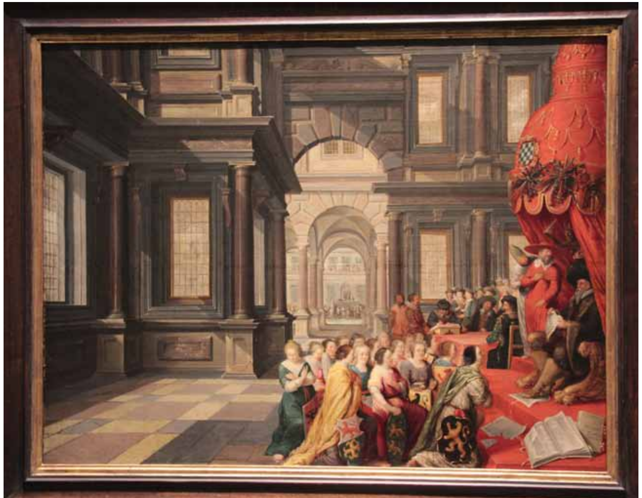
Dirk van Delen (1605 - 1671): Allegorie auf die Tyrannei des Herzogs von Alba, um 1630. Utrecht, Museum Catharijneconvent.

Inzwischen hatten die Reformierten in den niederländischen Provinzen Spaniens sich erhoben und 1566 in einem revolutionären Bildersturm „papistische“ Symbole aus den Kirchen gezerrt und öffentlich verbrannt – wie es auch Ottheinrich in Heidelberg 1556 mit eigener Hand getan hatte. Der König im fernen Madrid griff mit harter Hand durch