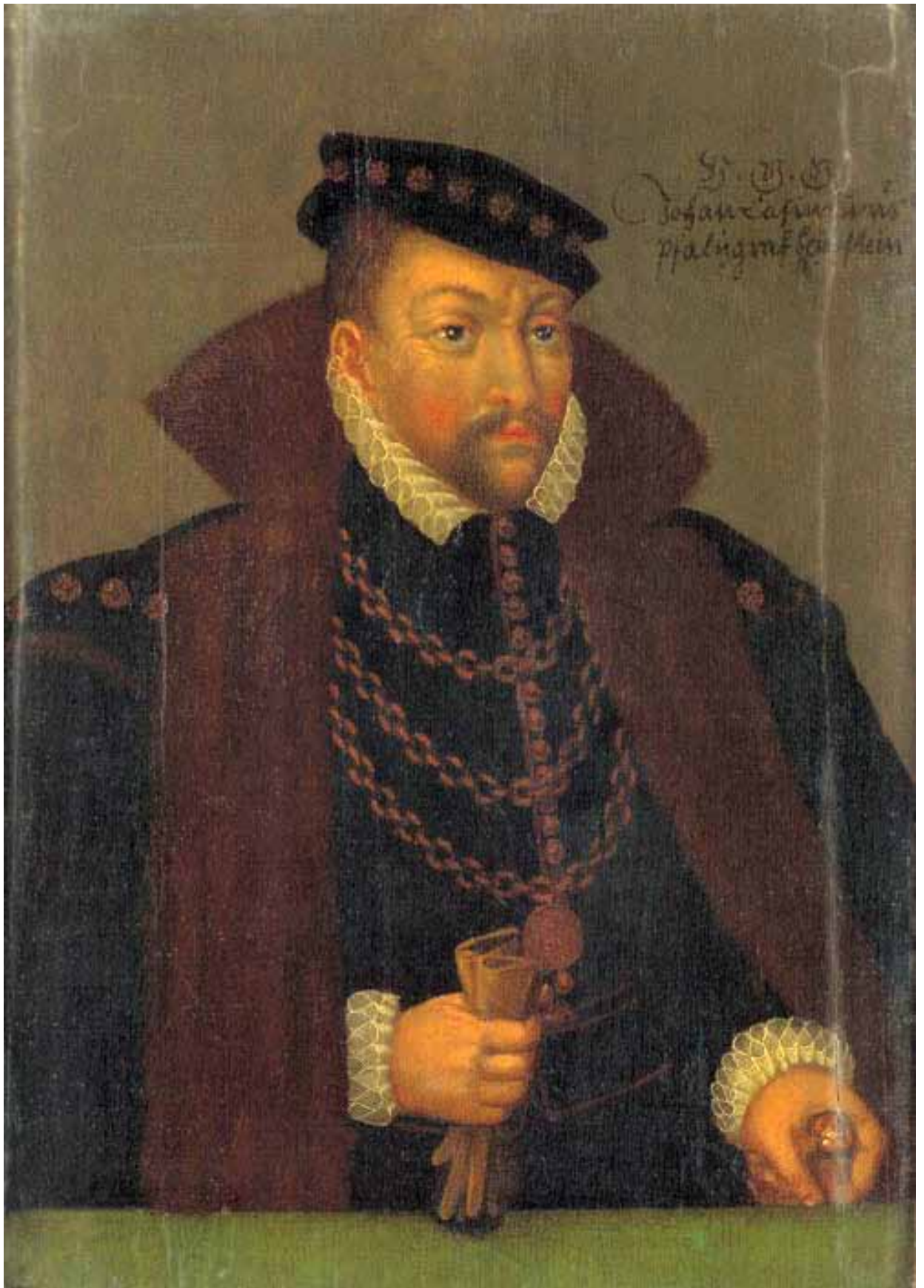
Unbekannter Maler: Porträt Johann Casimirs von Pfalz-Simmern, Kuradministrator der Pfalz. um 1590