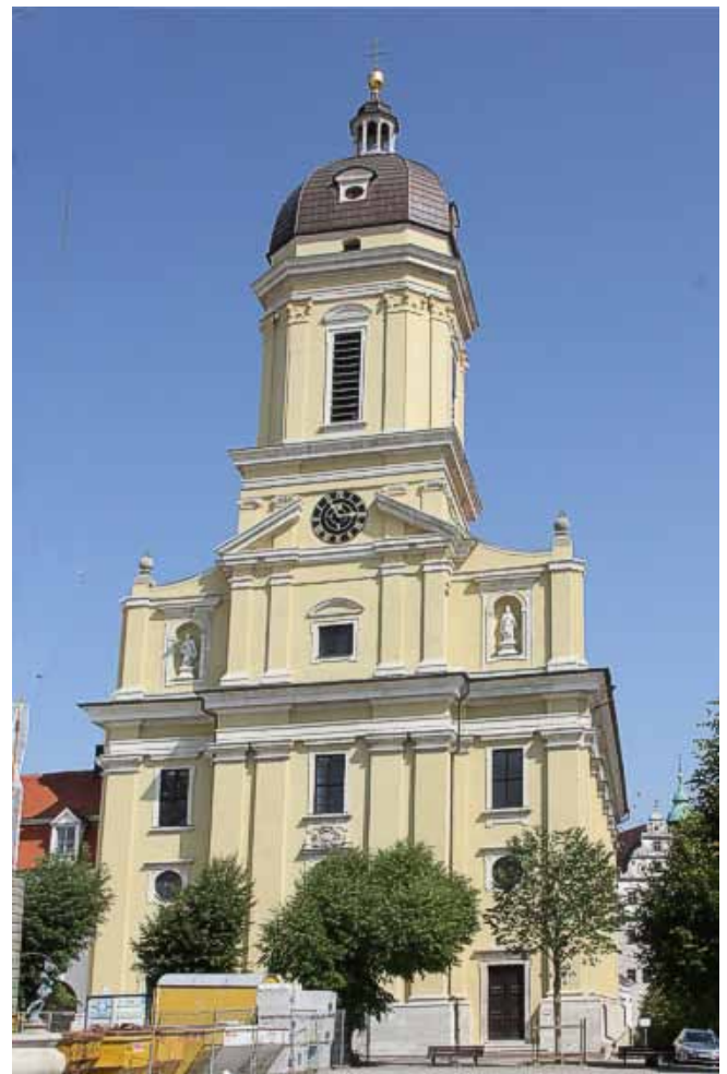
Die Hofkirche in Neuburg (Donau), als protestantische Hofkirche begonnen, als Jesuitenkirche vollendet

zwischen England, den Niederlanden, Frankreich, Pfalz-Neuburg, der Kurpfalz und Brandenburg gegen den Kaiser, Bayern und Spanien. Die Armeen sind geworben, die Truppen gerüstet, die Habsburger besetzen Jülich. Christian von Anhalt sieht die Chance für den großen europäischen Krieg, der die leidige Konfessions- (und Macht-) Frage löst, doch da geschehen zwei Katastrophen fast gleichzeitig. Der französische König Heinrich IV. wird 1610 von einem Attentäter ermordet, Friedrich IV. von der Pfalz stirbt im selben Jahr – zu jung, um die hochfliegenden Pläne auch nur ansatzweise zu realisieren. Der Krieg findet nicht statt.