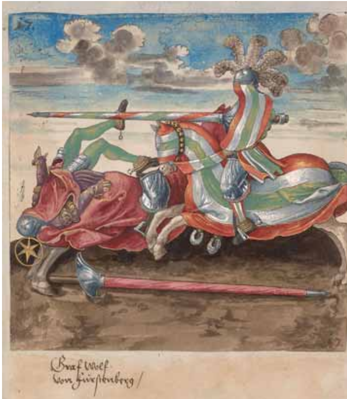
Turnierbuch Freydal. KHM, Wien, Kunstkammer Süddeutsch, 1512-1515